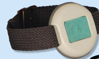
Spritzwassergeschützter Funksender im Armbanduhren-Format

Leicht zu bedienende Zusatzgeräte erweitern den Aktionsraum des CareCall home und geben dem Benutzer weitere räumliche Unabhängigkeit: