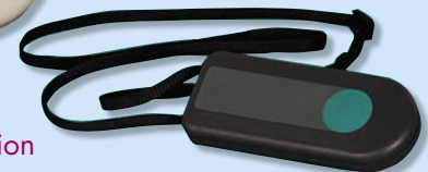
Mobiler Funksender zum Umhängen mit Druck- und Zugfunktion